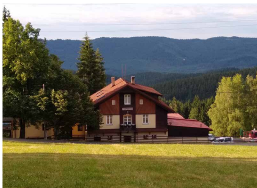
chata sv. Josefa