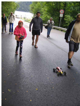
procházka kolem přehrady Šance (Maňáskovi)