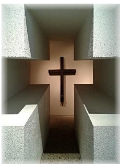
Billy Graham Center, Wheaton, Illinois, USA

Přeji Vám všem Boží pokoj v nejistotě, Boží pomoc v nemoci, Boží dary ve službě druhým a trpělivost v modlitbách.