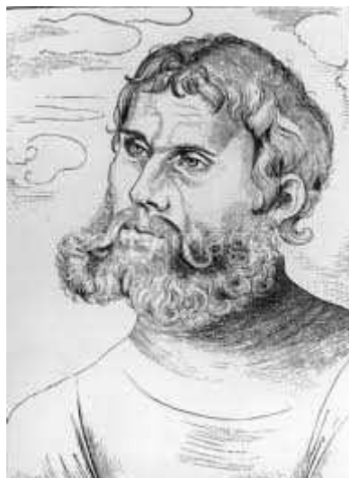
Jiný Luther - tentokrát s vousem

Zeptal jsem se člověka, jemuž ta zahrada patří, cí že jsou ty děti. Řekl mi: „To jsou děti, které se rády modlí, učí se a jsou hodné. Tu já na to: Milý pane, já mám taky chlapečka, jmenuje se Jeníček Lutherův. Nemohl by i on přijít do této zahrady, aby jedl krásná jablka a hrušky a projížděl se na koníčcích a hrál si s těmi dětmi?“ Muž řekl: Když se rád modlí, učí se a je hodný, tak může - a Lipp a Jošt také! Až sem přijdou, budou hrát na píšťaly, bubínky, loutny a jiné nástroje, a také tančit a střílet z malých kuší. A ukázal mi tam v zahradě hezkou louku k tancování. Visely tam zlaté píšťaly, bubínky a rozkošné stříbrné kuše. Ale bylo to brzy a děti ještě nesnídaly. Proto jsem nečekal na jejich tance a řekl jsem mu: „Milý pane, teď to jdu všechno napsat svému malému synku Janíčkovi, aby byl pilný v modlitbě, aby se rád učil a byl hodný, a tak mohl přijít do téhle zahrady. Ale on má ještě sestřičku Leničku, tu musí vzít s sebou!“ Odpověděl mi: Dobrá. Jdi a napiš mu to!“ Proto se, milý Honzíčku, uč a radostně se modlí a taky řekni Joštovi a Lippovi, ať dělají totéž. Tak se spolu dostanete do téhle zahrady. Poručím tě všemohoucímu Bohu.“