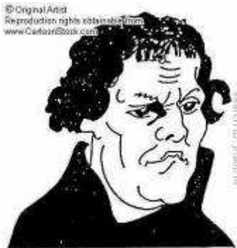
Luther byl muž rázné povahy

Rozezlený Eck ihned zamířil do Říma a Luthera vylíčil v tak temných barvách, že jinak shovívavý papež podepsal bulu, jíž přikazoval spálit nebezpečné knihy wittenberského profesora. Vzplanuly hranice a Lutherovy spisy lehly popelem.