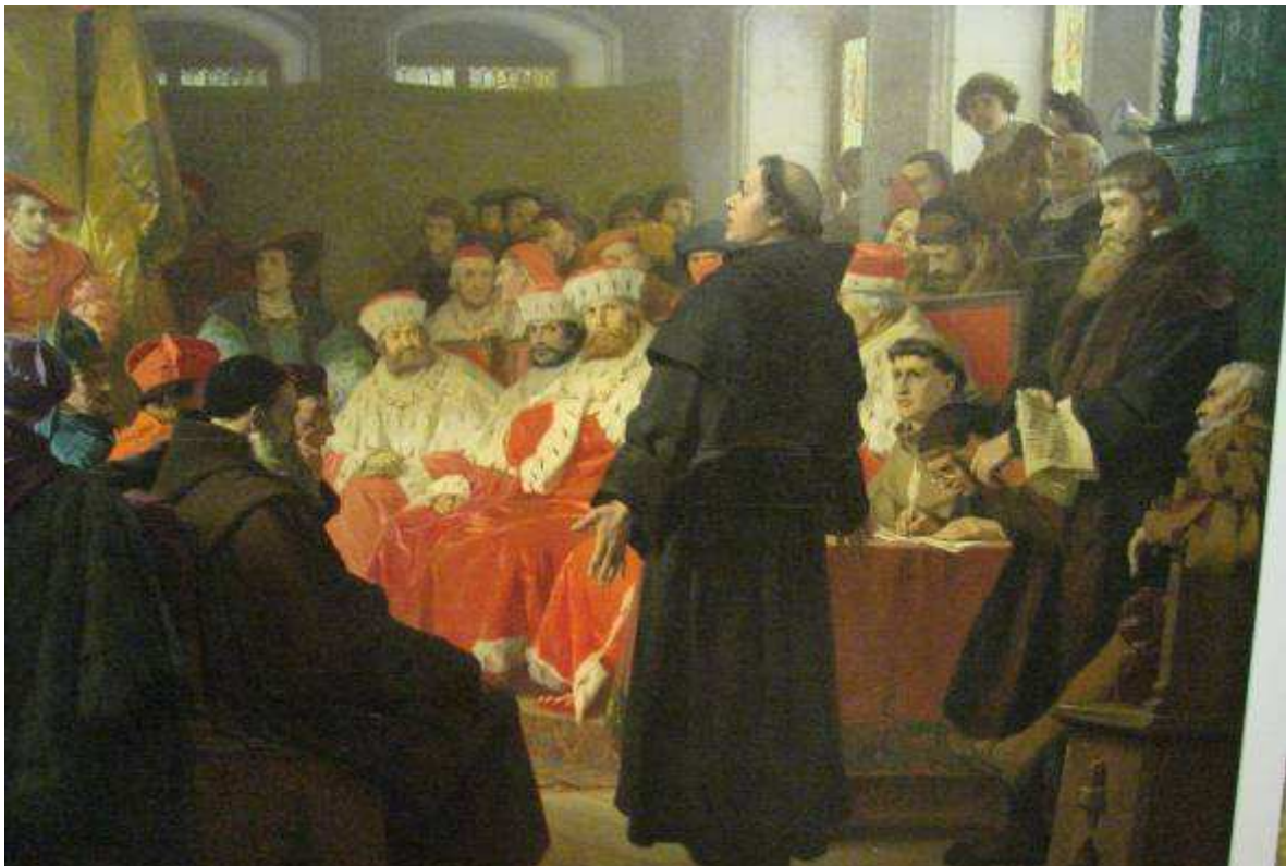
Luther ve Wormsu, připomíná nám tak trochu Husa v Kostnici. Však se právě Husa zastal a dostal potom za uši.

Přátelé Lutherovi cestu rozmlouvali. Vždyť mistr Jan Hus skončil na hranici, třebaže měl císařský glejt. Ale doktor Martin si byl jist, že nesmí couvnout. „ I kdyby bylo ve Wormsu d'áblů jako tašek na střeše, jdu tam! “ Wittenberská městská rada mu zapůjčila kočár. Na znamení císařovy ochrany jel před kočárem říšský herold. Nikdo nesměl ublížit ani jemu, ani jeho chráněnci. Signál trubky strážného zburcoval wormské měšťany z poledního klidu. Vyhrnuli se do ulic, aby zahlédli teď už slavného řeholníka. Kočár si davem zvědavců jen stěží razil cestu.