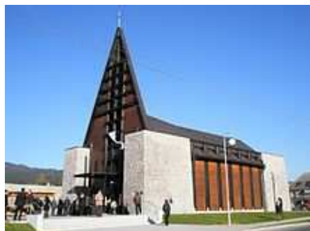
Nový kostel Luterské církve v Písku u Jablůnkova z ruky arch. Cieslara.

Od luterské reformace se odštěpili odpůrci křtu dětí. Odtud i jejich jméno - novokřtěnci, anabaptisté. Ti křtili své stoupence podruhé. Byli pronásledováni a zvláště krutě potrestáni, když v německém městě Münstent zavedli „Království Boží, ve skutečnosti hrůzovládu. Rozprchli se po celé Evropě a dostali se i na Moravu. Zde vynikali příkladným životem. Lidé je nazývali habáni a některá vrchnost si velmi vážila jejich spořádanosti i umění hrnčířského řemesla. Dodnes se keramika s ornamenty jelínků a stylizovaných květů, jak je užívali novokřtěnci, označuje jako keramika habánská.