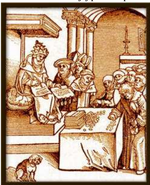
Obchod s odpustky

K nejbohatším mužům v celé německé říši patřil dozajista bankéř Fugger z Augsburgu. Rudné doly v Evropě i v Americe pro něj těžily drahé kovy, dovoz vzácného koření z nedávno objeveného světadílu mu přinášel pohádkové zisky. Mezi jeho zákazníky patřil sám Karel Habsburský. Vypůjčil si u něj úctyhodnou částku, aby měl čím podplatit říšská knížata a ta jej pak na oplátku zvolila bez námitek císařem.