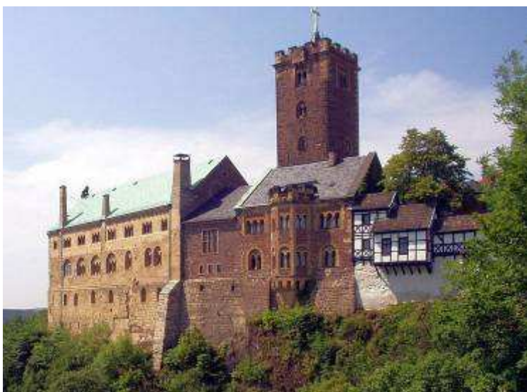
Hrad Wartburg - Lutherovo útočiště. Snad právě tento hrad jej inspiroval ke složení slavné písně.

Skutečnost však byla jiná. Sotva se podivní jezdci octli z dohledu vyděšeného kočího, posadili svého vězně na koně a uháněli s ním cestou necestou, jako by chtěli zmást případné pronásledovatele. „Saský lišák“, jak kurfiřtu Fridrichovi často přezdívali, neponechal nic náhodě. Hodinu před půlnocí projeli hradní branou a padací most za nimi uzavřel cestu.