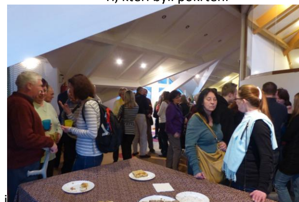
... a společenství po shromáždění.