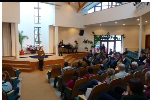
Shromáždění bylo v modlitebně sboru na Šeberově