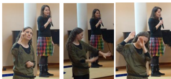
Do znakového jazyka byly překládány i písně