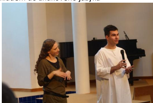
Stejně jako svědectví, která zazněla