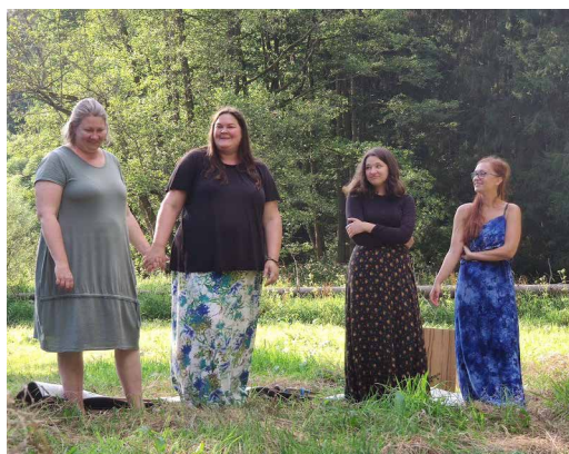
Autor: Kateřina Tmejová