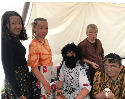
Autor: Jan Olšák