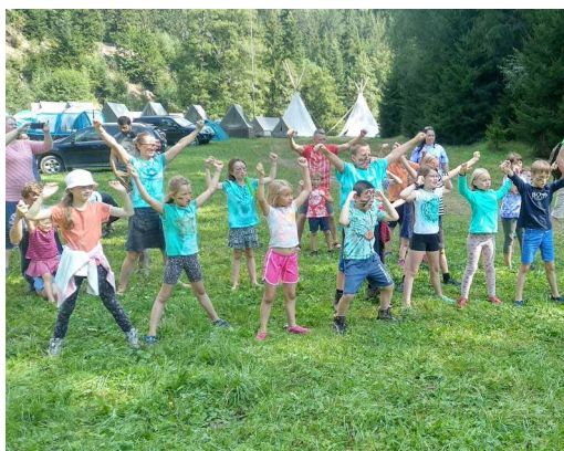
Autor: Petr Vilém