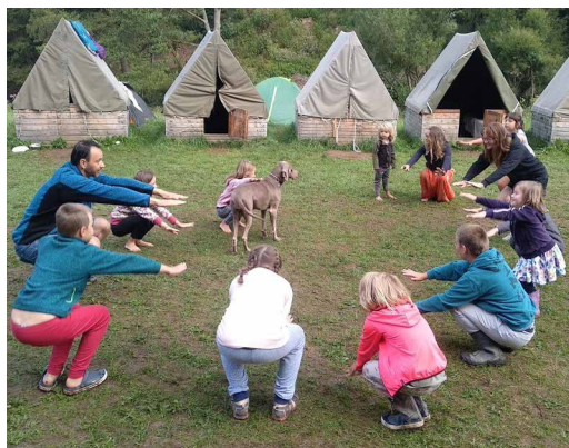
Autor: Petr Vilém