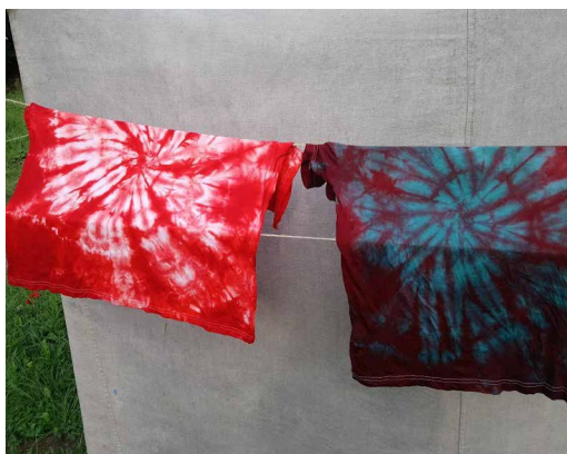
Autor: Jitka Vilémová