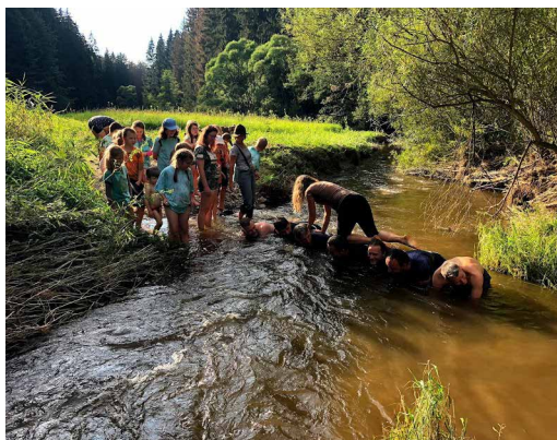
Autor: Vít Svoboda