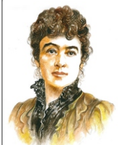
Bertha von Suttner