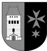
Městská část Praha 14