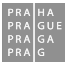
Magistrát hlavního města Prahy