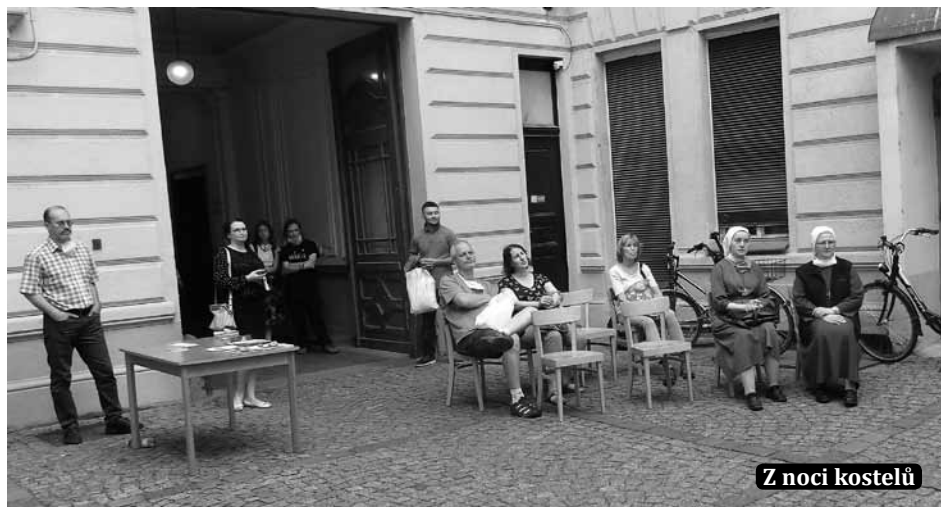
Z noci kostelů