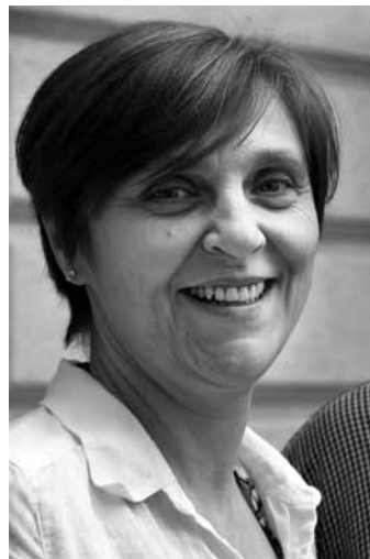
Připravila Petra Veselá

V prosinci 2019 jsme si s manželem řekli, že si uděláme rok 2020 tzv. uklízečí. Když pak přišla polovina března a s ní nouzový stav, šla jsem po ulici a říkala Pánu Bohu: „Pane, ale to jsi nemusel zastavit celý svět, abychom si s manželem mohli trochu uklidit ve všech našich aktivitách.“ Brzy se ale ukázalo, že pro někoho, kdo dostal od Pána Boha mocný energetický zdroj, nebude ani zastavení v podobě nouzového stavu skutečným zastavením. Moje povolání patřilo mezi ta, která se ze dne na den téměř zastavila, což pro mě ale nebyl povel k zalehnutí na kanape. Naopak. Začala jsem hledat, kde by ta moje energie mohla dojít uplatnění. Mnozí z vás jste asi zaznamenali některé z mých aktivit. A přiznám se, že každodenní docházení do Soukenické, telefonáty či mailly s vámi pro mě byly tím, co mně nedovolilo si pořádně uvědomit, že se děje něco nenormálního. Celý můj život je jeden velký kalup, a to nezměnila ani koronakrize. Pán Bůh mi dal energii, tak se ji snažím využívat v jakémkoliv stavu světa.