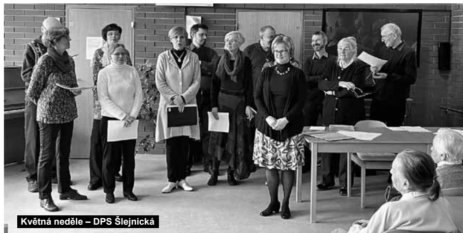
Květná neděle – DPS Šlejnická