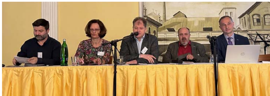
Z Výroční konference Církve bratrské